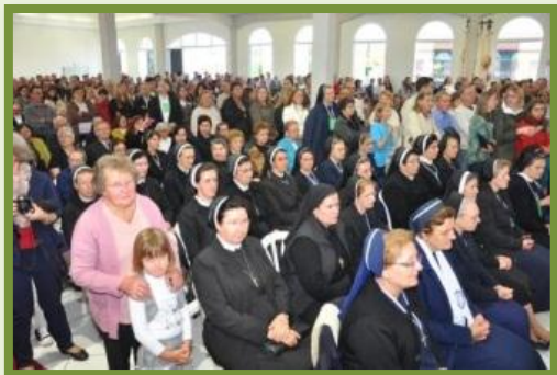
“Ви – світло світу. Ви – сіль землі” (Мт 5,13.14).

3. Священники, богопосвячені особи та катехити хай не бояться пропонувати молодим людям шлях богопосвяченого життя, заохочувати до нього та підтримувати молоду людину у її виборі, вказувати на велику благодать вибору богопосвяченого життя,