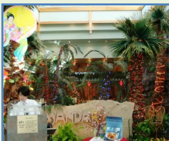
Restaurante chinês em Toronto