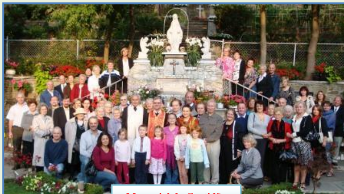
Memorial da Gratidão

As primeiras peregrinas ao memorial foram três senhoras de três paróquias de Toronto. Antes da recitação do primeiro terço, o sacerdote sugeriu para que rezassem em suas intenções. Uma das senhoras rezava por sua filha, que por muito tempo se desligou dela, nem mesmo lhe telefonava. Alguns momentos após a oração, tocou seu celular. Era a ligação de sua filha pela qual rezava. Esse fato emocionou os presentes. Foi a primeira graça recebida pela primeira peregrina ao monumento. Desde então o número de peregrinos vem aumentando, muitos vindos de longe, até de outros países. Muitas pessoas receberam várias graças e já aconteceram casos