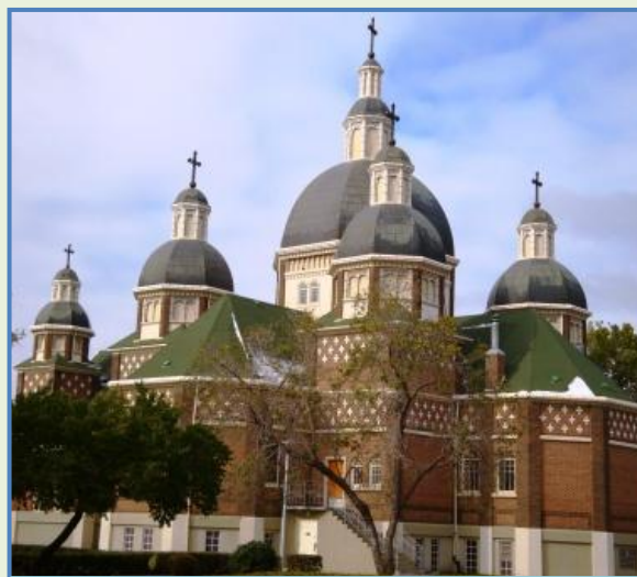
Catedral São Josafat de Edmonton

Visitei e fotografei aproximadamente 43 capelas e igrejas, muito bonitas pela arquitetura e principalmente pela arte iconográfica. Em geral, tudo é detalhadamente projetado e cuidadosamente executado, numa harmonia estética esufizante. Em algumas dessas igrejas, o visitante realmente se sente como se estivesse vendo o céu sobre a terra. Mas algumas pessoas manifestaram sua inquietação: “e se existe pouca participação de fiéis...”