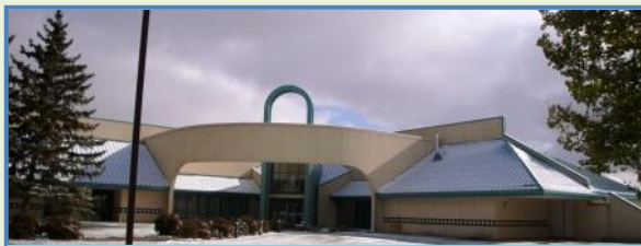
Museu dos Padres Basilianos em Mundare

O Canadá tem um programa oficial de incentivo e preservação da memória histórica, étnica e cultural de seus povos. Por isso, apóia a construção e organização de museus, que são numerosos. Pessoalmente, gostaria de visitar ao menos algum museu paleontológico, mas faltou tempo. No Canadá existem muitos campos de escavação arqueológica de pesquisa sobre os dinossauros e vários museus desse gênero.