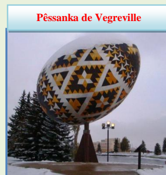
Pêsanka de Vegreville