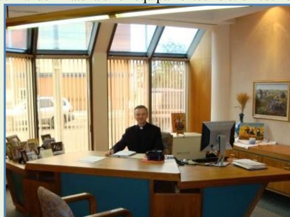
Gabinete do Eparca de Edmonton Dom Davi Motiuk

As estruturas paroquiais e eparquiais, também as das ordens e congregações religiosas, são ótimas e funcionam com muitos funcionários, geralmente com qualificação profissional, em escritórios separados, utilizando materiais e equipamentos eletrônicos de