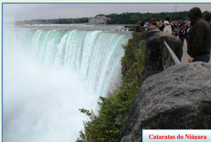
Cataratas do Niágara

O Canadá é conhecido por seus incontáveis lagos. São cerca de dois milhões no total. A gente viu uma pequena parte. Lindos!