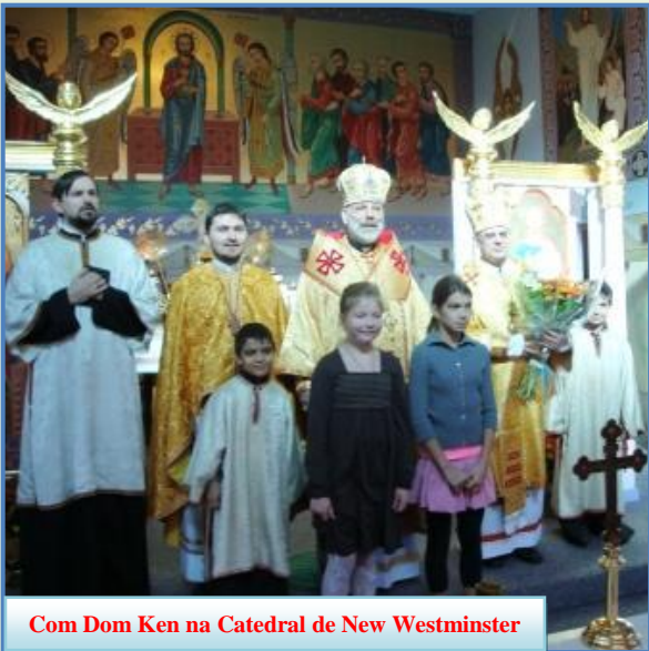
Com Dom Ken na Catedral de New Westminster

Dom Ken Nowakowski, Eparca de New Westminster, que esteve no Brasil no início deste ano para dirigir o encontro com reitores e formadores de